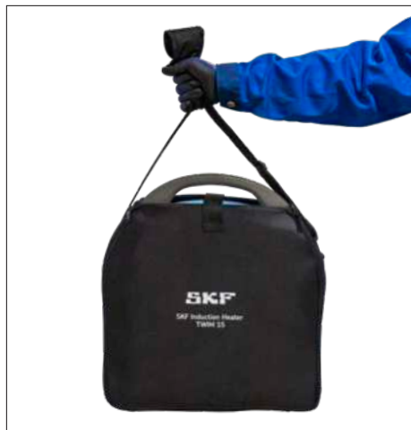
Рис. 3 и 4 – Сумка для транспортировки и хранения TWIM 15