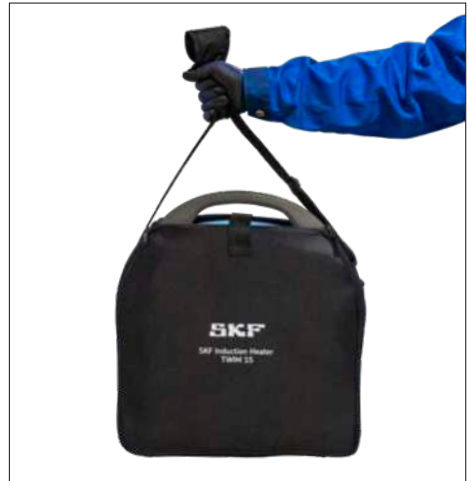
Fig. 3 & 4 – Sacoche de transport et de rangement du TWIM 15