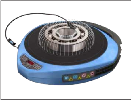
Fig. 1 – Campo magnético ao redor do rolamento

O aquecedor por indução portátil TWIM 15 consiste em uma placa de polímero reforçado com fibra de vidro, resistente a altas temperaturas, e bobinas eletromagnéticas, situadas abaixo da placa. Quando o aquecedor está ligado, uma corrente elétrica passa pelas bobinas e gera um campo magnético oscilante, que não aquece a placa superior em si. Porém, assim que um componente de ferro ou aço inoxidável é colocado sobre a placa, o campo magnético induz muitas correntes elétricas pequenas (correntes parasitas) no metal dos componentes.