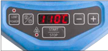
图 2 - 用户界面