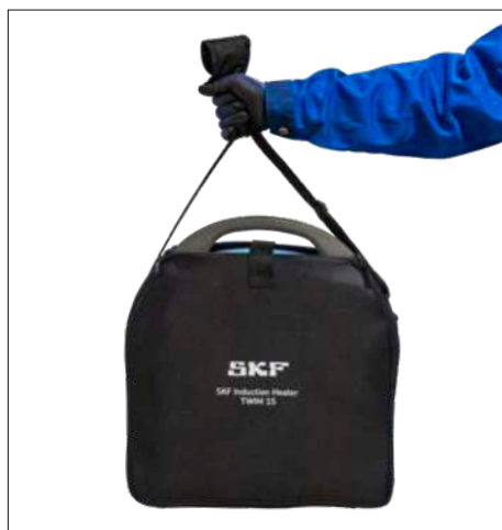
Fig. 3 & 4 – Borsa per trasportare e riporre il TWIM 15