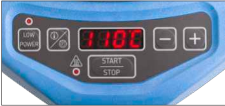
Fig. 2 – Brugergrenseflade