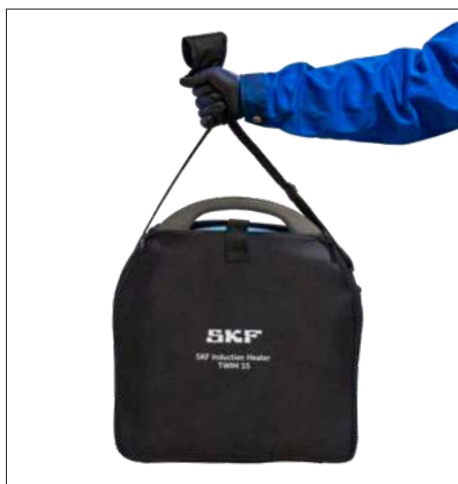
Fig. 3 og 4 – Bære- og opbevaringstaske til TWIM 15