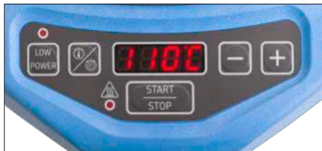
Fig. 2 – Interface de usuário