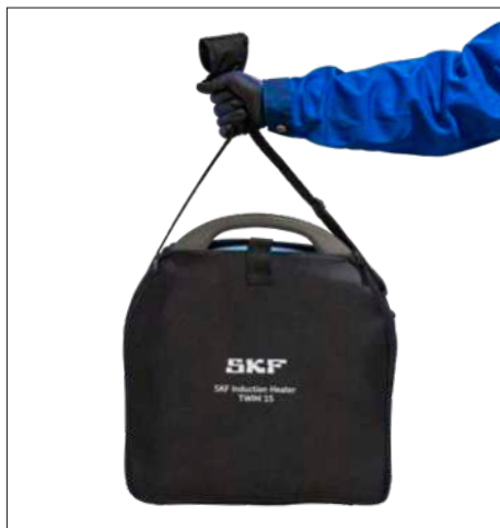
Fig. 3 e 4 – Bolsa de transporte e armazenamento do TWIM 15