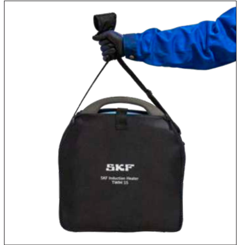
图 3 & 4—TWIM 15 携带包